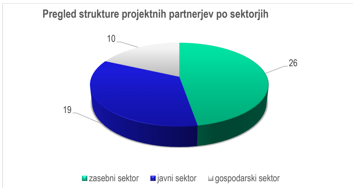
GRAF 3: Pregled strukture projektnih partnerjev po sektorjih

Opomba: vsak projektni partner je štet samo enkrat.